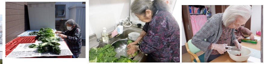
目分量で入れられた塩でもちょうどいい塩加減でとても美味しい〜♪