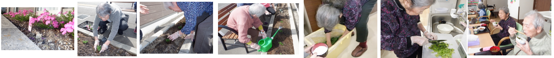
花壇に芝桜を植えました